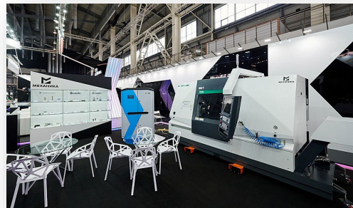
Концепт-модель «умного» цеха.