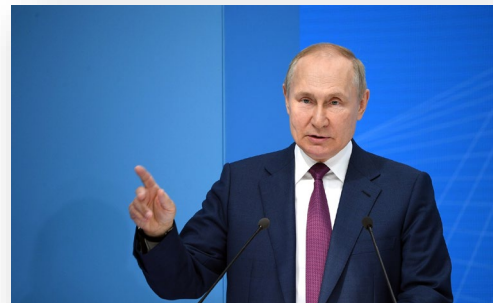
Президент РФ Владимир Путин.