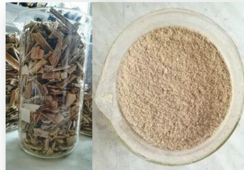
Исходный борщевик и готовый сорбент.