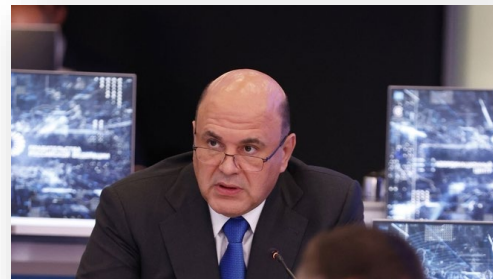
Председатель правительства РФ Михаил Мишустин на стратегической сессии по транспорту.