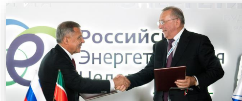
Р. Минниханов, президент Республики Татарстан, и Н. Токарев, президент ПАО «Транснефть».