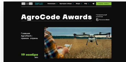
Скриншот главной страницы сайта AgroCode Awards .