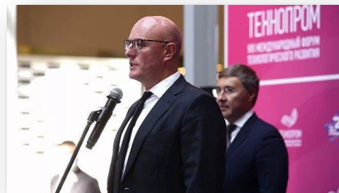
Д. Чернышенко, вице-премьер РФ.