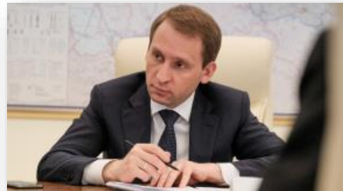
А. Козлов, министр природных ресурсов и экологии России.