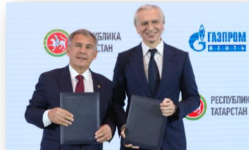
Р. Минниханов, президент Республики Татарстан, и А. Дюков, председатель правления «Газпром нефти».