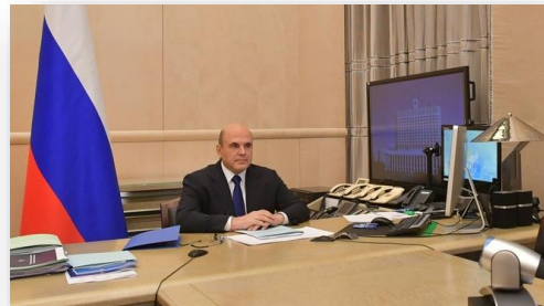
Председатель правительства Михаил Мишустин. Фото: Government.ru

Поддержка программных решений («Умное производство»), технологии виртуальных испытаний продукции («Цифровой инжиниринг»), совершенствование механизмов подбора кадров («Новая модель занятости»), расширение возможностей по кастомизации продукции («Продукция будущего»). Government.ru 08.11.21