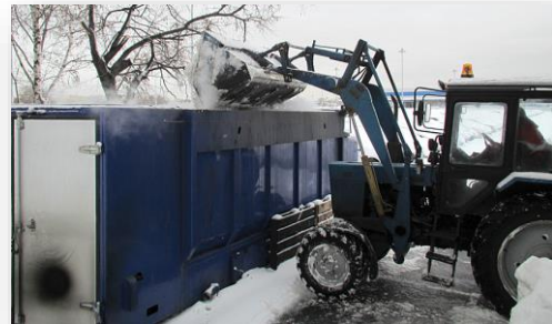
Мобильная снегоплавильная установка.

Издание содержит информацию о так называемых «фабриках мысли» (Think Tanks) России, Армении, Белоруссии, Казахстана и Киргизии. В Атлас вошли 213 организаций, которые в пяти странах ЕАЭС занимаются аналитикой. РАН 08.11.21