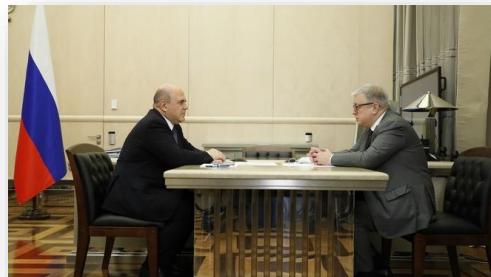
Встреча Михаила Мишустина с научным руководителем НИУ ВШЭ Ярославом Кузьминовым.

Об этом рассказал Заместитель Председателя Правительства Дмитрий Чернышенко. Вице-премьер отметил, что исследование проводится в рамках федерального проекта «Искусственный интеллект». Организаторами опроса выступают Аналитический центр при Правительстве России и ВЦИОМ при участии МГУ имени М.В.Ломоносова и Сбербанка. Government.ru 11.11.21