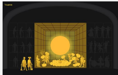
Сценографический эскиз одной из научных опер Сколтеха.