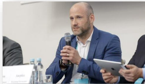
Заместитель министра экономического развития РФ Владислав Федулов.