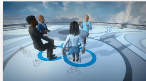
Скриншот групповой образовательной сессии в виртуальной среде с применением решения Vive Sync.