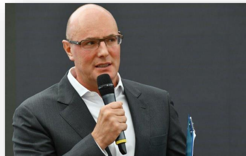
Вице-премьер Дмитрий Чернышенко.