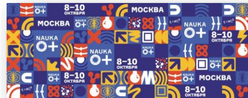
Баннер фестиваля Nauka 0+. Фото: Научная Россия