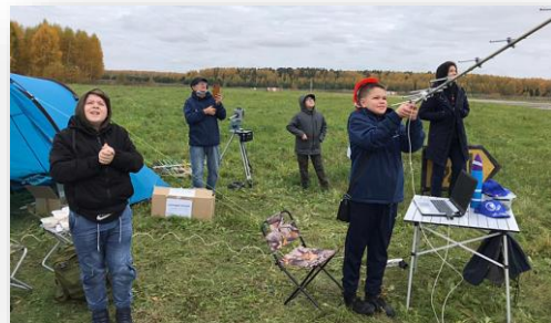
Юные куряне ловят телеметрию со своего «спутника».