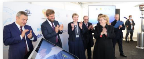
Церемония открытия центра технологий и микрофабрикации.