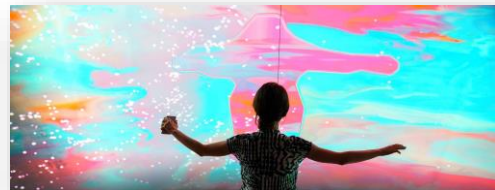
Арт-проект «Цифровые двойники». Фото: Газпром нефть.