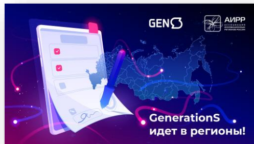
Баннер межрегиональной акселерационной программы в сфере GovTech.