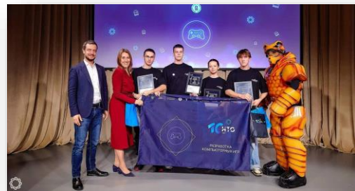
Победители НТО по направлению «Разработка компьютерных игр».