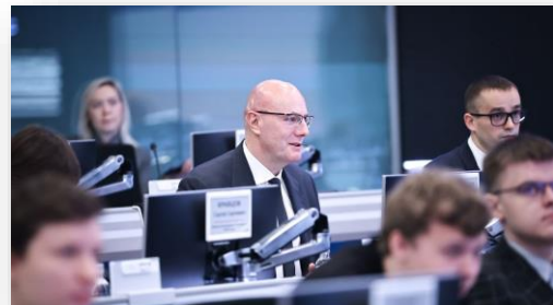
Вице-премьер Дмитрий Чернышенко на запуске Всероссийской олимпиады по ИИ.

Правительство РФ установило экспериментальный правовой режим (ЭПР) в сфере цифровых инноваций по эксплуатации беспилотных авиационных систем (БАС) и тестированию систем защиты от противоправного применения беспилотных воздушных судов (РЭБ) на территории Новгородской области. ЭПР предоставляет возможность его участникам тестировать системы радиоэлектронного противодействия беспилотникам. Также беспилотники будут использоваться для перевозки грузов и мониторинга. Минэкономразвития 31.03.2025