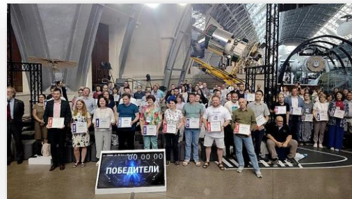
Прошлогодний финал Всероссийский олимпиады учителей физики «Лига Лучших».

Впервые в РФ разработано конструктивно-техническое решение отечественной мобильной системы измерения количества и показателей качества нефти и нефтепродуктов (СИКН) с производительностью до 800 м 3 /ч. На разработанную конструкцию мобильной СИКН Роспатентом выдан патент на изобретение. Авторами изобретения являются работники центра автоматизации, энергетики и сертификации оборудования трубопроводного транспорта ООО «НИИ Транснефть». ООО «НИИ Транснефть» 01.04.2025