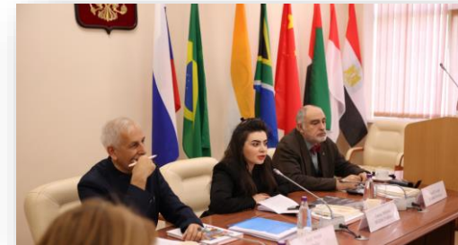
Заседание I Съезда Педагогического Совета БРИКС.