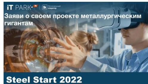
Баннер конкурса «Steel-Start 2022».