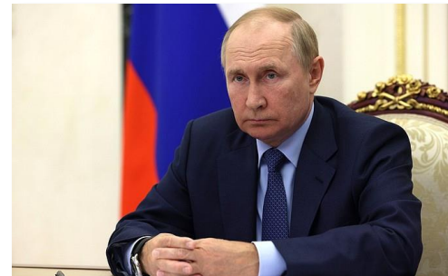
Президент РФ Владимир Путин.