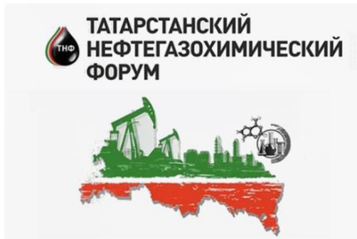
Баннер Нефтегазохимического форума.