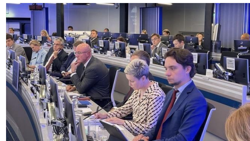
Дмитрий Чернышенко на заседании комиссии по научно-технологическому развитию.