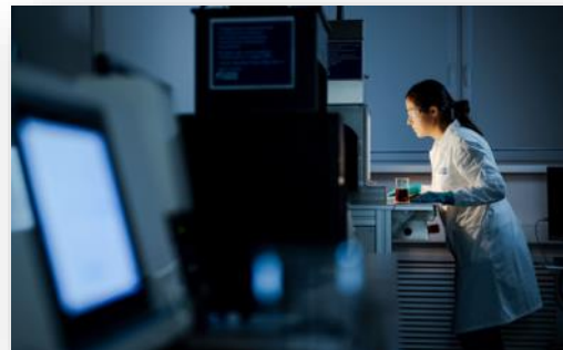
Лаборатория «Газпромнефть – смазочные материалы».