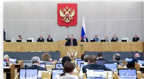
Правительственный час в рамках пленарного заседания Госдумы.