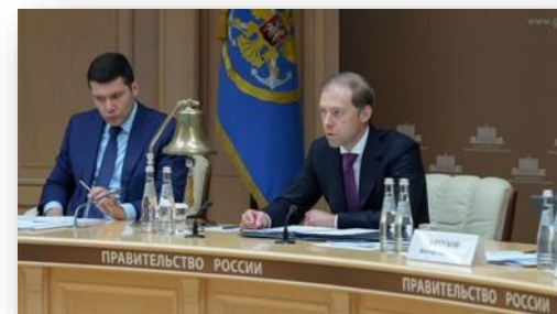
Зампредседателя правительства РФ, министр промышленности и торговли Денис Мантуров на Морской коллегии.