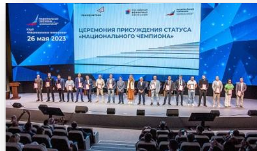
Церемония объявления новых национальных чемпионов.