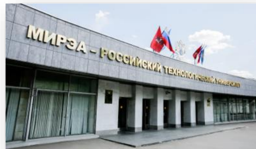
АСИ поддержало проект РТУ МИРЭА по подготовке специалистов БПЛА.