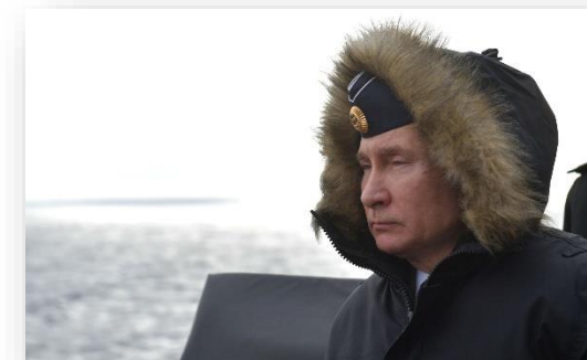
Президент РФ Владимир Путин на борту ракетного крейсера «Маршал Устинов» во время совместных учений Северного и Черноморского флотов.