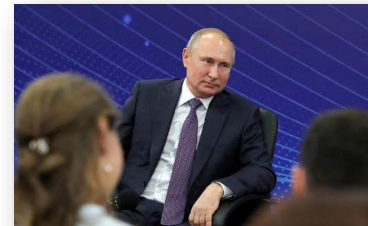
Президент РФ Владимир Путин на встрече с представителями общественности в Светлогорске Калининградской области.