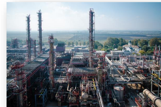
НПЗ компании «Нефтяная индустрия Сербии» в Панчево.