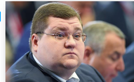
Председатель Совета директоров АО «Национальная инжиниринговая корпорация» Игорь Чайка