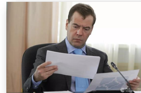
Премьер министр РФ Дмитрий Медведев