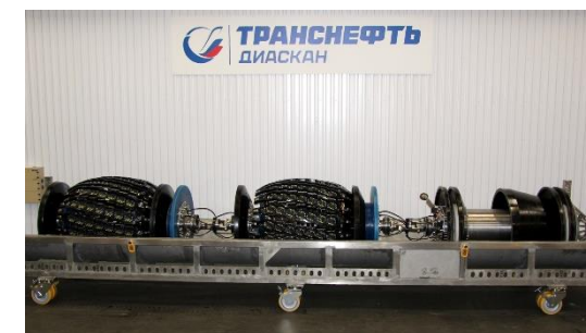
Ультразвуковой дефектоскоп с измерительной системой на фазированных решетках.