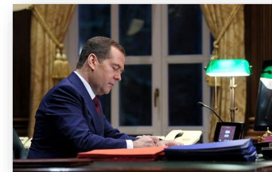
Премьер министр РФ Дмитрий Медведев