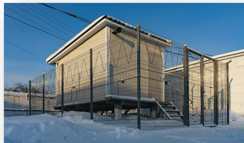
Система охраны периметра «Трибоник» может быть размещена на любых типах ограждения.