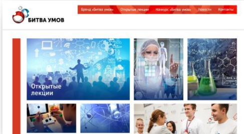
Скриншот главной страницы сайта «Битва умов»