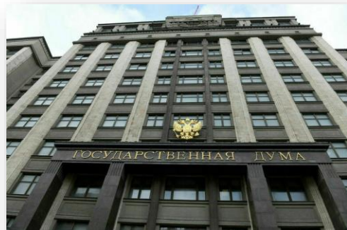
Государственная дума РФ.